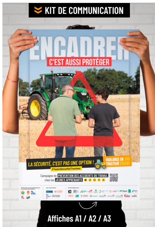
Affiches A1 / A2 / A3